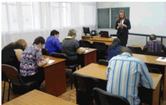
Педагоги в роли студентов