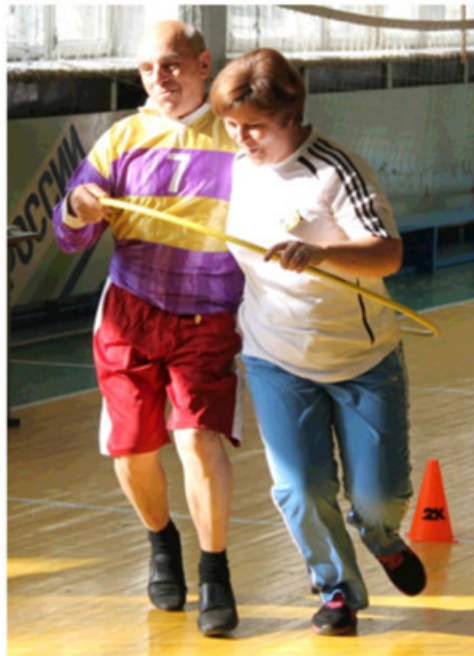
- Если не добежим, то хоть согреемся!