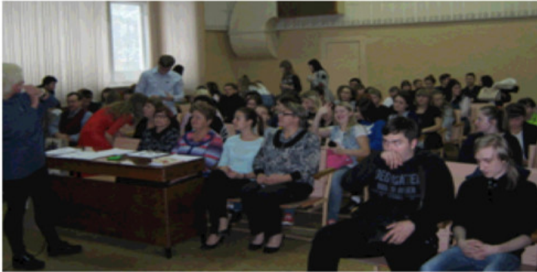
Ажиотаж в зрительном зале

Октябрь - месяц традиционного конкурса «Алло, мы ищем таланты!». В конкурсе приняли участие и показали свои таланты студенты всех курсов. Представляем фотоотчёт о конкурсе: