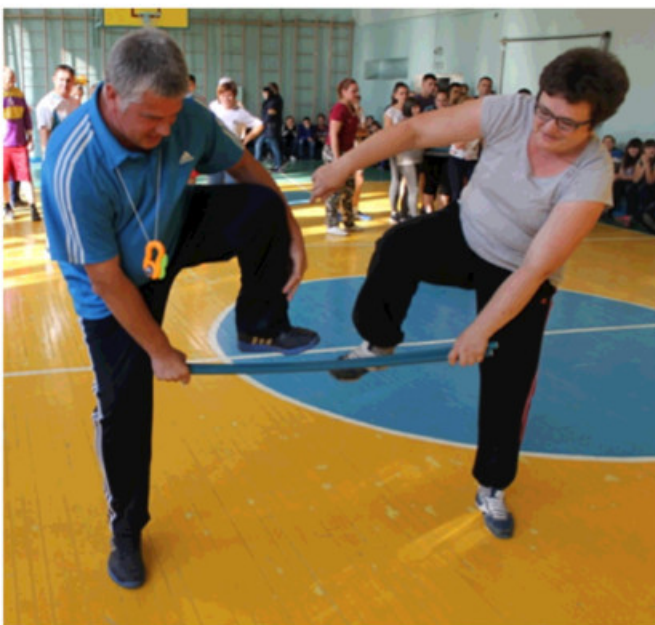
-Где мои 16 лет!