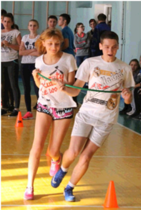
- Ну, что, рванули!!!

Из спортивного зала техникума 4 октября раздавались взрывы смеха. Это был конкурс «Весёлые старты» между командой педагогов и студентов. Разнообразные забавные конкурсы были на самом деле весёлые, а, как известно, смех продлевает жизнь и делает её здоровой.