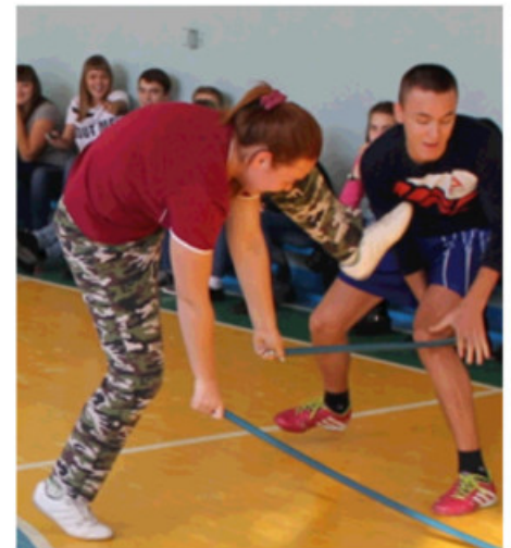
- Ногами сильно не размахивай!