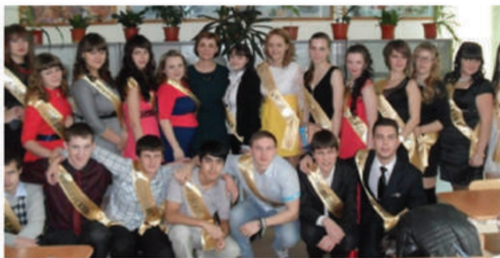
Выпускники 2 группы!