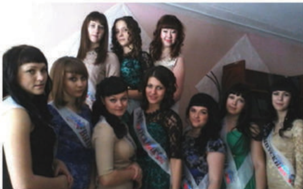
Выпускницы 1 группы!