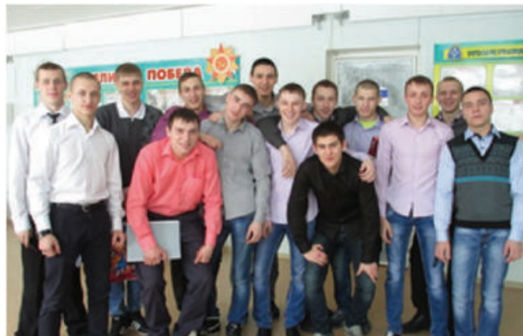
группа № 311: «А мы всегда готовы!»