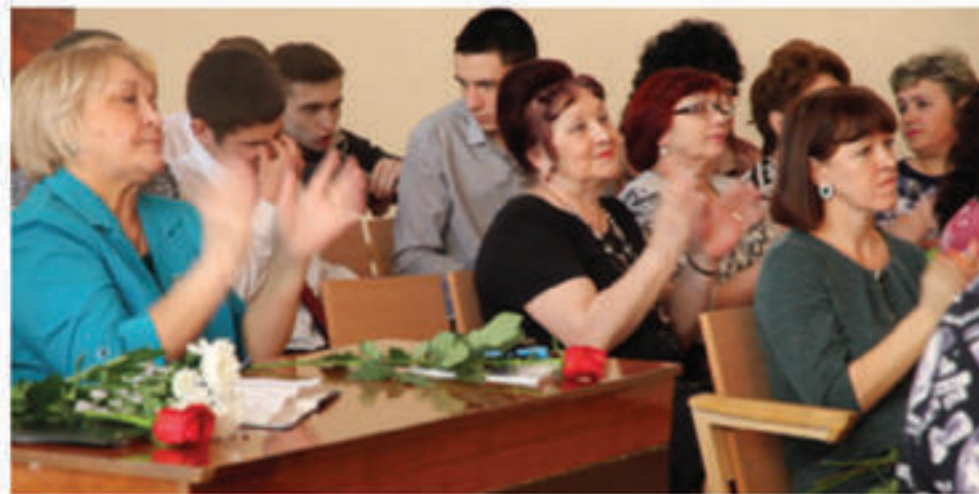
- Не забывайте нас, выпускники!