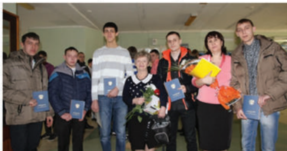
Выпускники 308 группы!