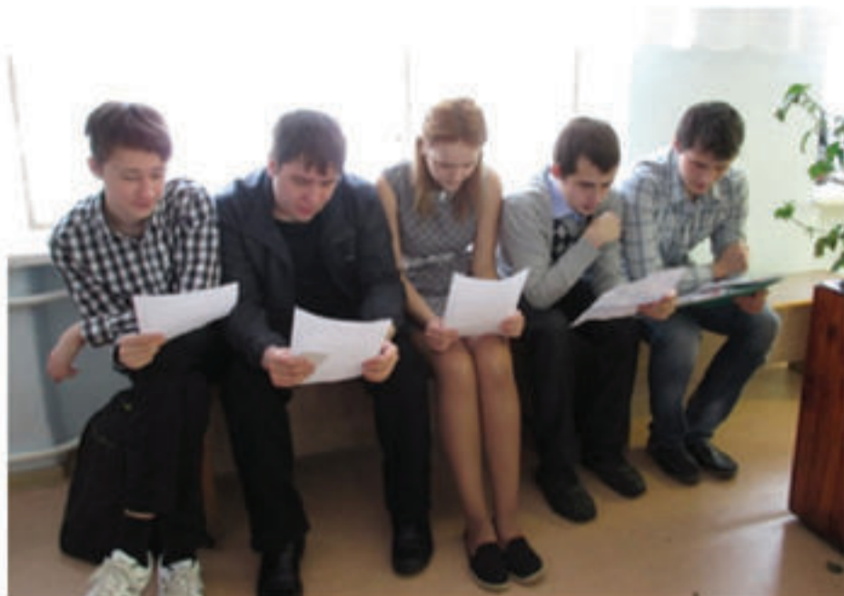
группа № 2: «Эх, ещё бы денёк...»