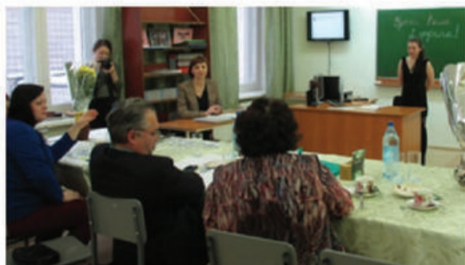
Удивительная вещь - экзамен. Одних он удивляет вопросами, других ответами.