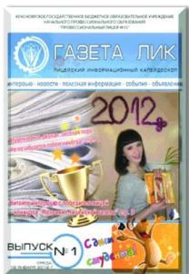
Обложка первого номера «ЛИКа»